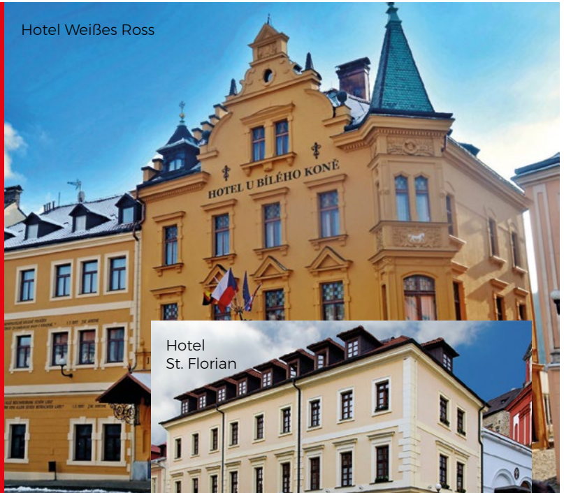
Hotel St. Florian